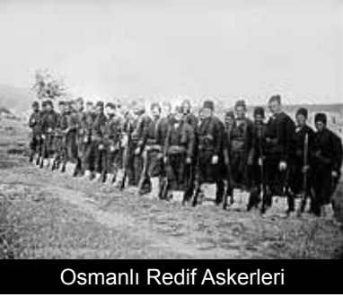
Osmanlı Redif Askerleri

Balkanlardaki Yunanistan, Bulgaristan, Sırbistan ve Karadağ, Rusya'nın aracılığıyla aralarında anlaşarak, Türkleri Balkanlardan atmak istediler. Hele Trablusgarp Savaşı onları da cesaretlenmişti. Balkan Ulusları, Osmanlı Devleti'nden, Makedonya'da hemen ıslahat yapmasını istediler. Bu istekleri reddedilince Karadağ Osmanlı'ya savaş ilân etti.