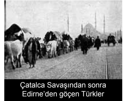
Çatalca Savaşından sonra Edirne'den göçen Türkler

İmparatorluk, bir kısım asker ve subayları ile Trablusgarb'da İtalyanlara karşı savaş içindeydi. Donanmasının bir kısmı 12 adalara saldıran ve işgal eden İtalyan donanması ile uğraşmakta veya Trablusgarb'a asker lojistik destek taşımaktaydı. Yemen'de çıkan isyan sonrası büyük bir hata içine düşerek Rumeli'deki taburların bir kısmını bu isyanı bastırmak için Yemen'e gönderdi.