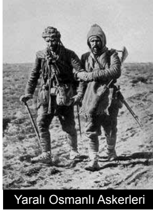
Yaralı Osmanlı Askerleri

Osmanlı Devletinin Balkanlar'daki 4 devlete karşı 1912-1913'de yaptığı savaşlardır. Bilindiği gibi, Avrupa Devletleri, Türkler'in 1071 yılında Anadolu kapılarından içeri girdikleri tarihten itibaren Haçlı seferlerini başlattılar. 1176 tarihinde Miryokefolon (Sandıklı) savaşında Türkler tarafından kesin olarak mağlup edilmelerine rağmen, Türkler'e karşı haçlı savaşları hiç bitmedi.